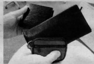
デキる人は3つの財布を使い分けている

分のお金を、たとえ小銭で もデスクの上に置いてお たり、ズボンのポケットへ 入れたままにしたりするの は危険だ。もし銀行のお金 と自分のお金が混ざってし まうようなことがあれば、